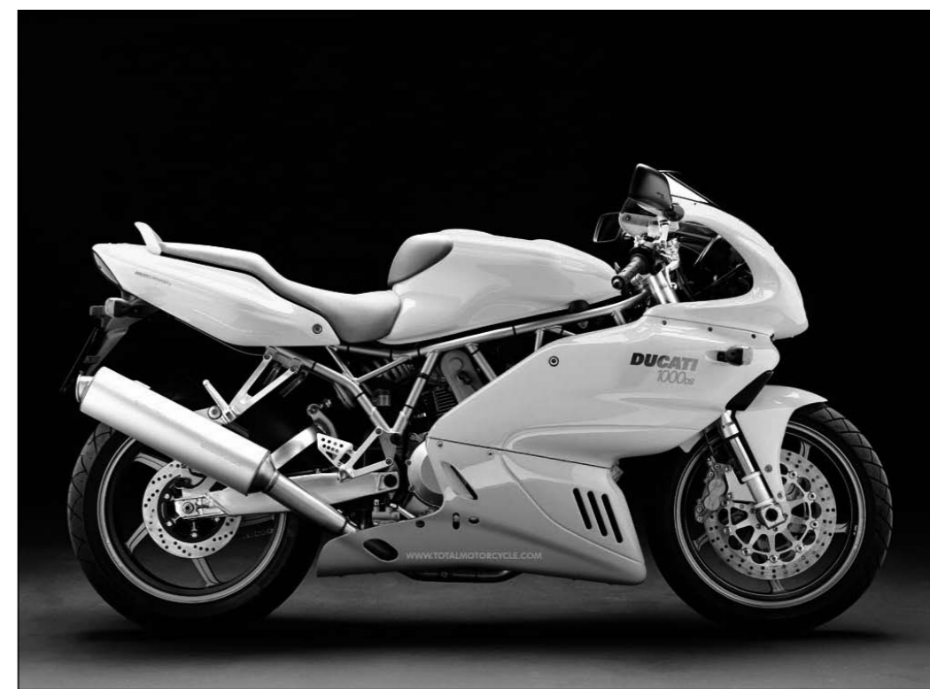
Ducatie 'Supersport 1000 DS', een motorfiets waar functionaliteit en beleving zijn verenigd in één ontwerp. Kan dat ook in de gebouwde omgeving?

Dit lijkt voor de hand te liggen, maar toch is het in de architectuur niet gebruikelijk om een dergelijk onderscheid te maken. Om een idee te krijgen van hoe een functioneel en een op de beleving gericht domein zich in één ontwerp laten combineren kunnen we kijken naar de vormgeving van moderne motoren, waar dit onderscheid wel wordt gemaakt. Zoals bij de Ducatie 'supersport 1000DS', waar constructie, uitlaat en