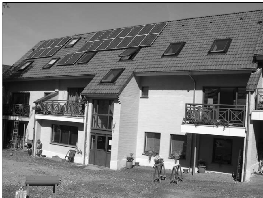
La Grande Cense exterieur