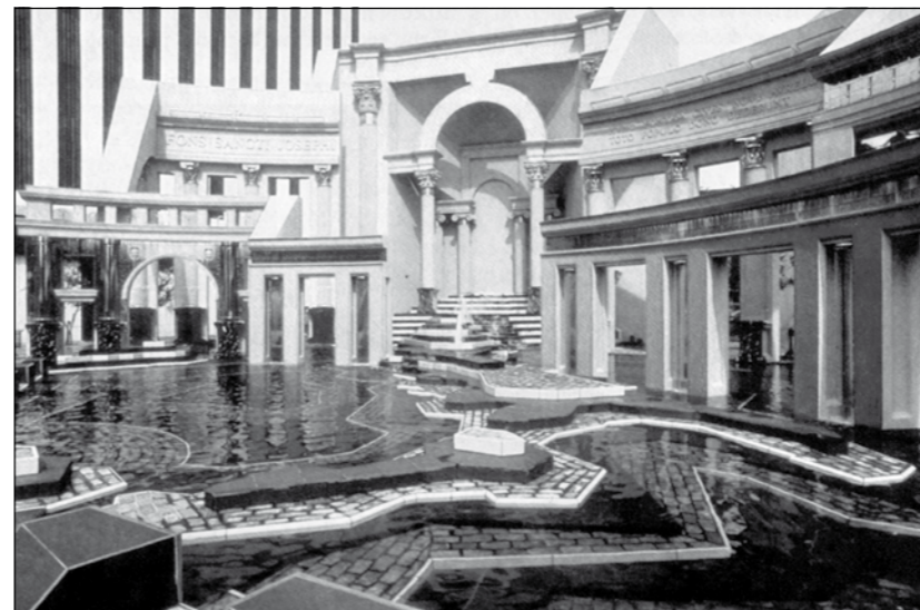
Klassieke stijlelementen met neonlicht

In bepaalde opzichten wel, de architectuur werd veelkleuriger dan ooit. Wijken kregen weer kleur op hun gezicht. Maar er gebeurde nog iets: er verschenen klassieke elementen in de architectuur, zoals aangeplakte zuiltjes en driehoekige bekroningen, zoals bij klassieke tempels. Was dat zo erg? Dat niet, maar het was steeds zo grappig, de ironie vierde hoogtij. Zo voorzag de architect Charles Moore zijn klassieke stijlelementen van neonlicht.