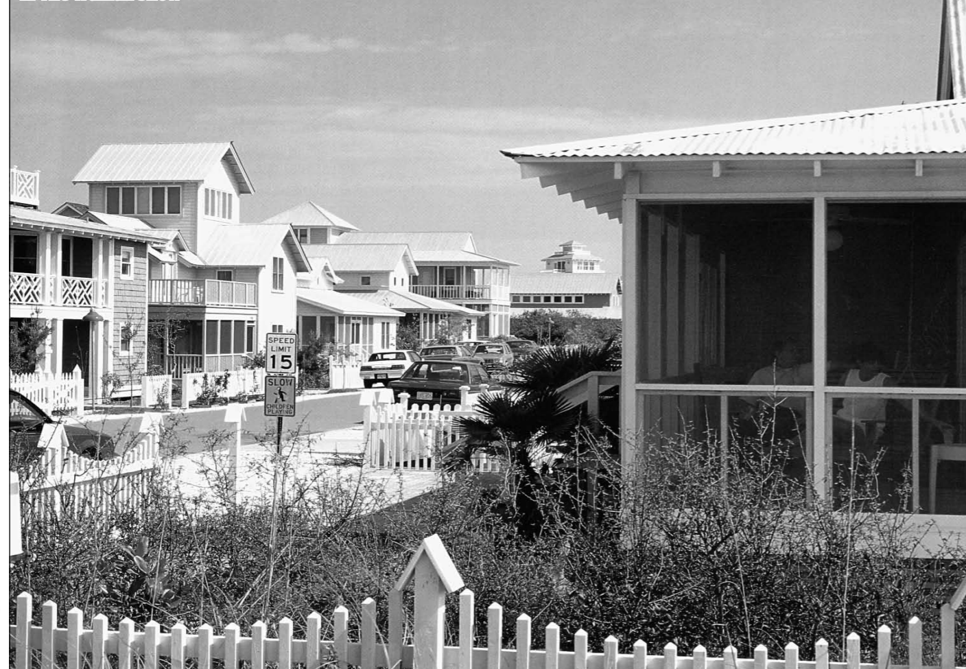
Het stadje Seaside dat werd gebruikt als decor in The Truman Show

Ruimtelijke kwaliteiten waardoor de functionaliteit weer verbonden kan worden met de betrokkenheid van degene die handelt terwijl ook de beleving weer een reële basis kan krijgen en meer kan zijn dan een relativiserende ironie of een spel in een capsule die onze onzekerheid en angstigheid nog versterkt.