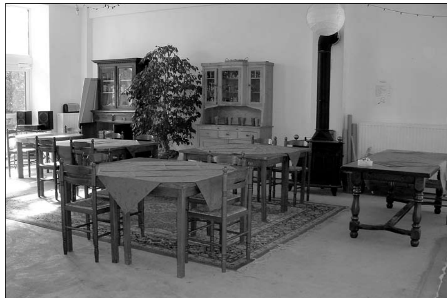
La Grande Cense gemeenschappelijke ruimte

tijd, energie en wijsheid. Een deel van de bewoners wilde bijvoorbeeld de zgn. 'passief wonen' (energieneutraal) kenmerken uitbreiden en verwarming door een warmtepomp. Vooral in de beginjaren is dat een flinke extra kostenpost. Dat zou voor de meeste andere bewoners boven hun budget gaan en besloten is toen de warmtepomp voor een beperkt aantal privé woningen te laten installeren. Andere woningen kunnen op termijn steeds meer 'passief' worden.