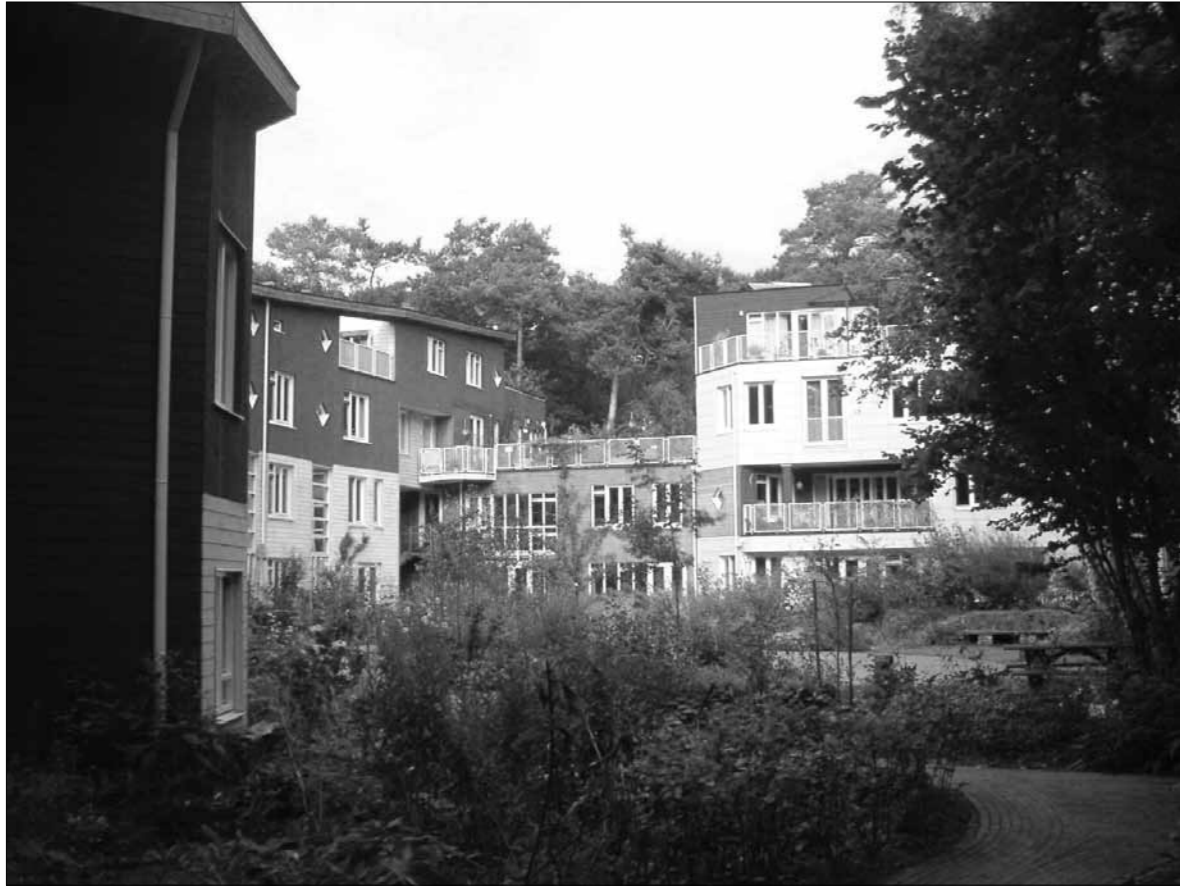
De voortuin van de 'Zonnespreng' in Driebergen. Ontmoetingsruimte in de poort.