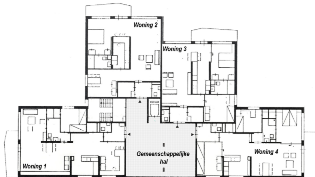
Experimentele flats in Overvecht. De gemeenschappelijke hallen functioneren als speel- en spelletjesruimte.

Een vroeg voorbeeld van een kleinschalige gedeelde voorziening vinden we in de experimentele flats in Utrecht Overvecht (1971). Hier zijn telkens 4 woningen gesitueerd rond een gemeenschappelijke 'hal'. Deze hallen werden en worden gebruikt als speelruimte voor kinderen, om te tafeltennissen, om spelletjes te spelen of voor een gemeenschappelijke maaltijd.