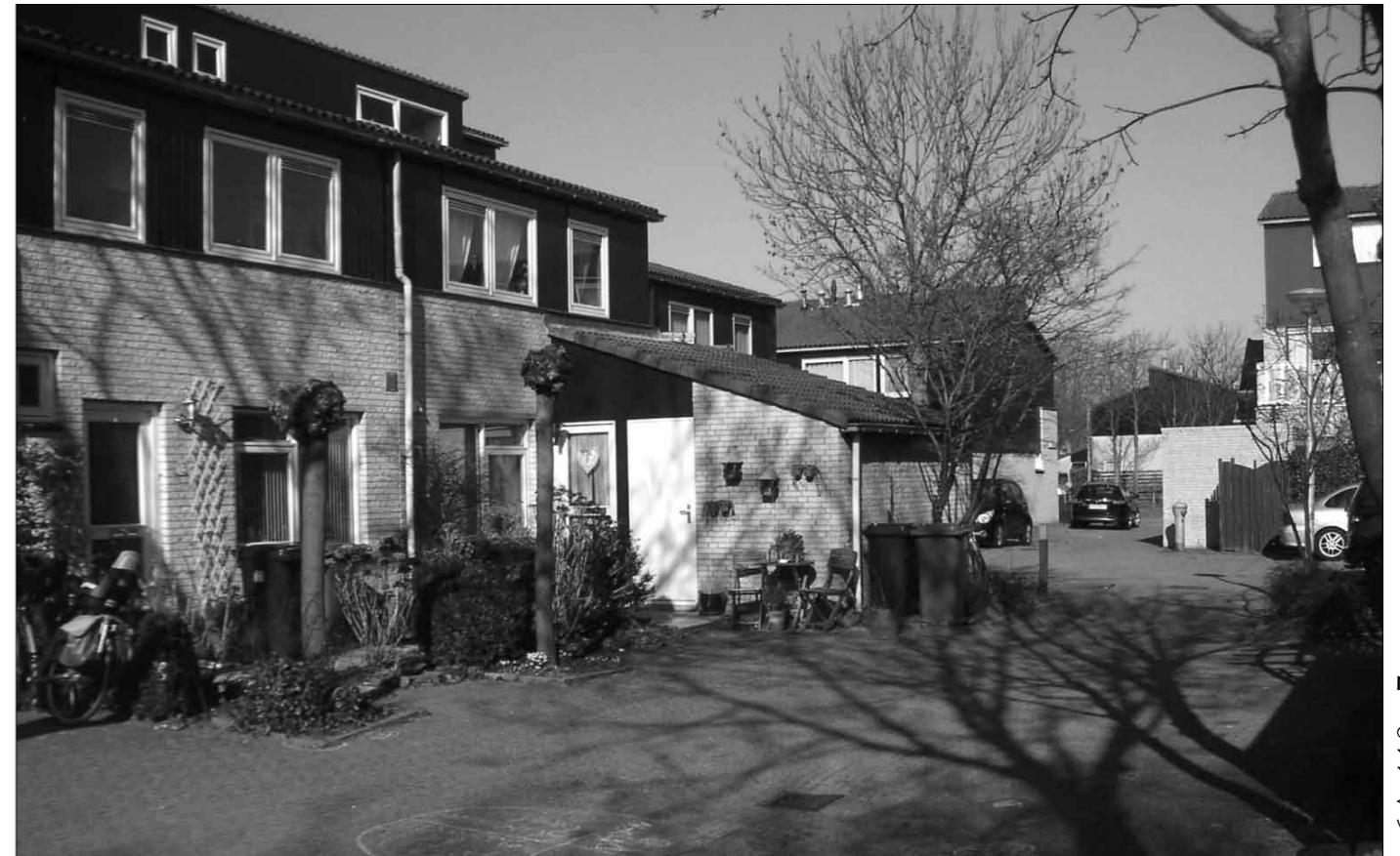
Een woonerf in Delft-Zuid, gebouwd in de tachtiger jaren.

Het is moeilijk om in de literatuur iets te vinden over groeps grootten, gekoppeld aan passende voorzieningen.