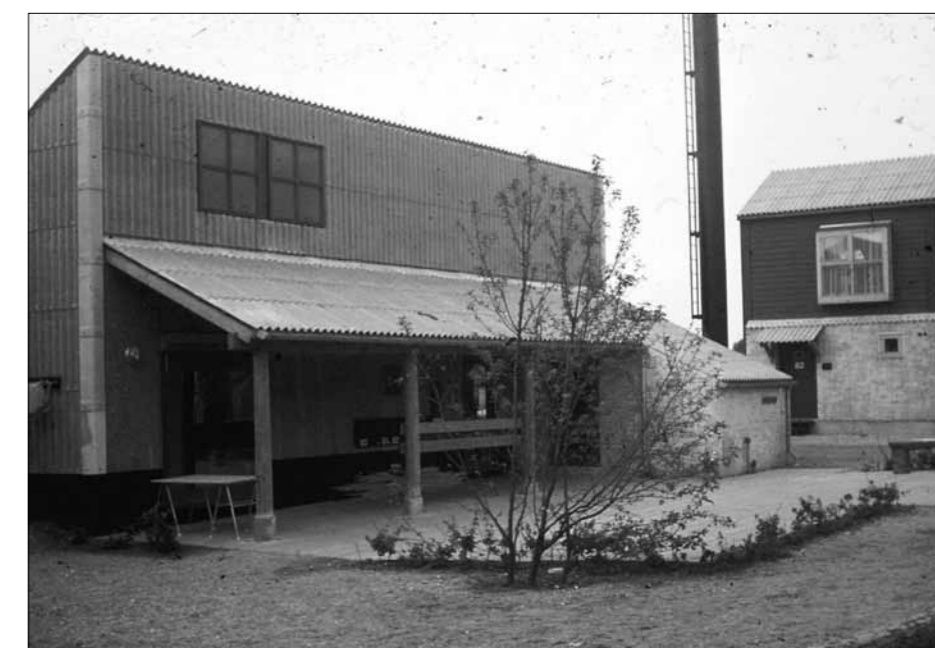
Het gemeenschappelijk bouwwerkje voor een 'familiegroep'. Zie ook de voorpagina.

dens met een grote gemeenschappelijke tuin, een ontmoetingsruimte, een kelder en een logeerkamer. (zie GA 115)